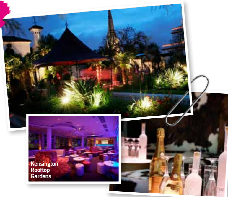
Kensington Rooftop Gardens

► WAT Londen is geen goedkoop stukje aarde. Om toch gebruik te kunnen maken van al het moois dat deze stad te bieden heeft, moet je slim zijn. Skip de peperdure hotels, slaap in een hostel of B&B en ga vervolgens op stap als Royal Duchess Kate Middleton. HOE? Door cocktails te drinken in de mooiste rooftop bars. WAAR De Kensington Rooftop Gardens zijn een groene oase in het centrum van Londen. Jude Law, Kate Moss en Kanye West chillen er regelmatig. Dineren kan in restaurant Babylon en drankjes nuttig je met waanzinnig uitzicht in The Club ( www.roofgardens.virgin.com ). Ook Boundary is populair. Deze bar hoort bij het Boundary Boutique Hotel en biedt een stunning view op de skyline van Londen ( www.theboundary.co.uk/rooftop ).